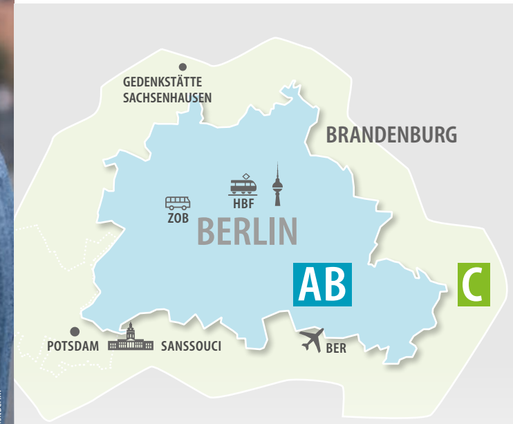
Kartografie: © Kartopolis